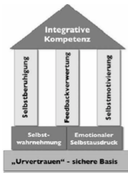
(Abbildung 1: Haus der Selbstkompetenz)

Selbstkompetenz wird hier im Weiteren als Basiskompetenz verstanden, die sich aus folgenden Bestandteilen zusammensetzt: 1. Gefühl von Vertrauen in die Welt, 2. Selbstwahrnehmung, 3. emotionaler Selbstausdruck, 4. Selbstmotivierung, 5. Selbstberuhigung, 6. Feedbackverwertung sowie 7. integrative Kompetenz. Die Beziehungen zwischen den Bestandteilen werden durch das Haus der Selbstkompetenz verdeutlicht: