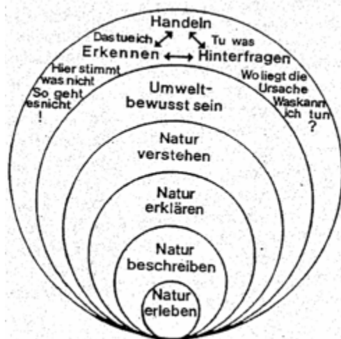
Abbildung 2: Ebenen des Naturverständnisses

Naturpädagogen müssen sich dafür in den Erlebnisprozess einbeziehen, auf die Naturerfahrung einlassen und handlungsorientiertes Lernen ermöglichen.